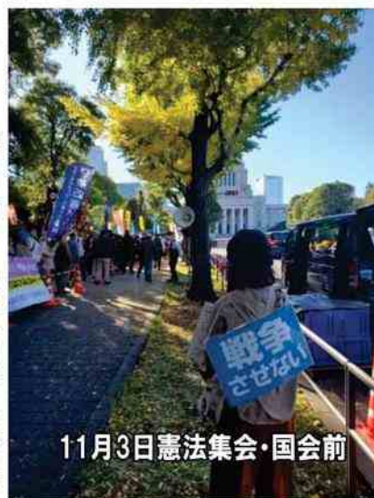
11月3日憲法集会・国会前

11月3日は「自由と平和を愛し、文化をすすめる日」を趣旨とする11月3日の国民の祝日です。1946年に日本国憲法が公布されたことにちなみ、1948年に「文化の日」として制定されました。毎年この日を記念して「憲法を守れ！」の集会が開かれています。